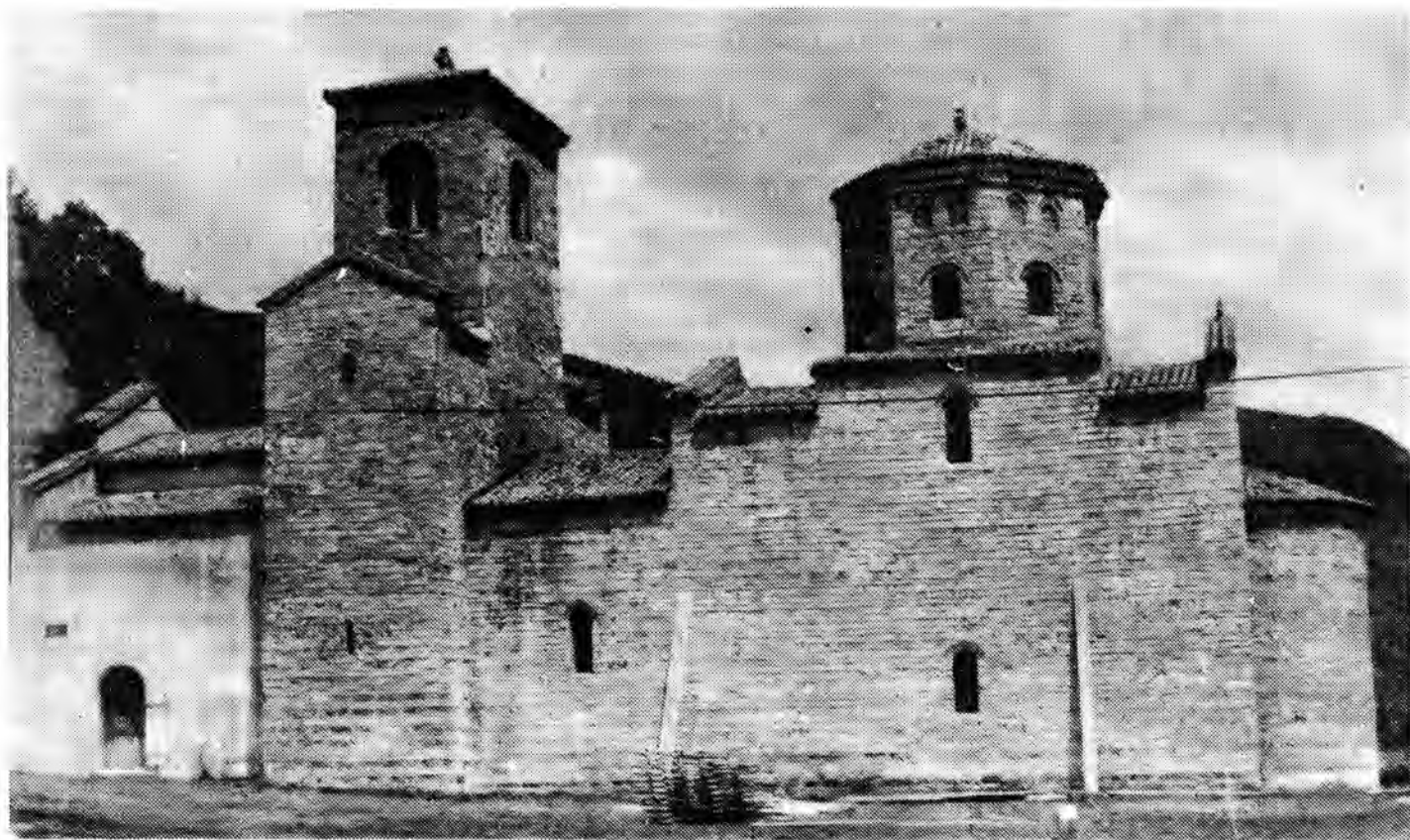
Центар духовности: манастир Ђурђеви Ступови, задужбина Немањића, код Берана

љених у варошима у Плаву и Гусињу (Лабани, Вучелићи, Ђулафићи, Ђукићи и др.) око 15-20 кућа.