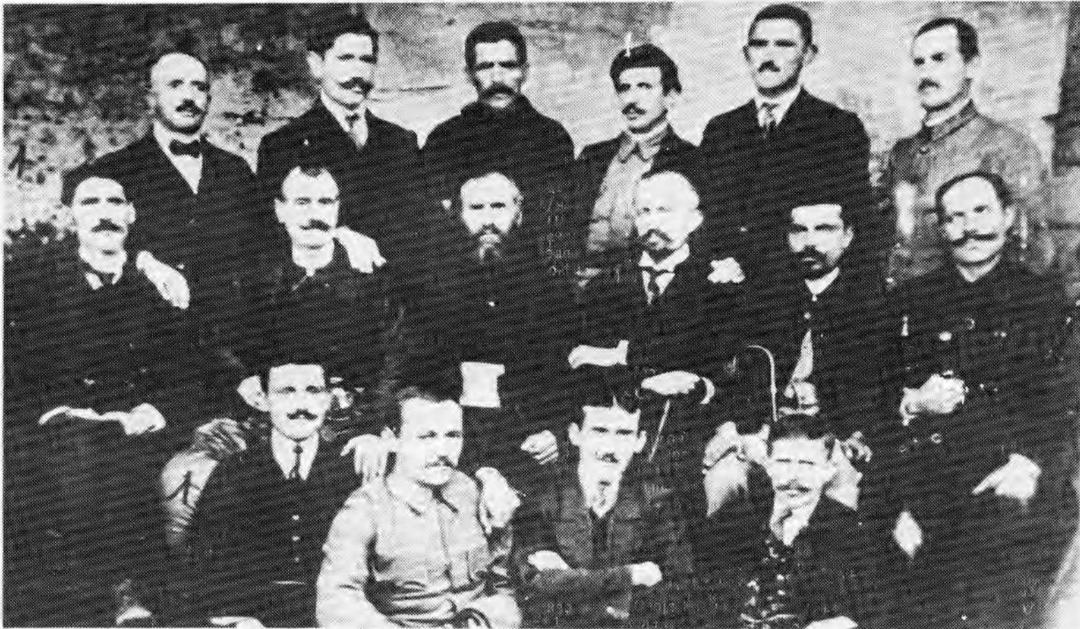
НА ФОТОГРАФИЈИ-народни посланици Велике народне скупштине српског народа у Црној Гори у Подгорици 1918. године, из Беранског округа:

Како су се тежње за стварањем јединствене државе у којој ће живети српски народ својевремено оствариле