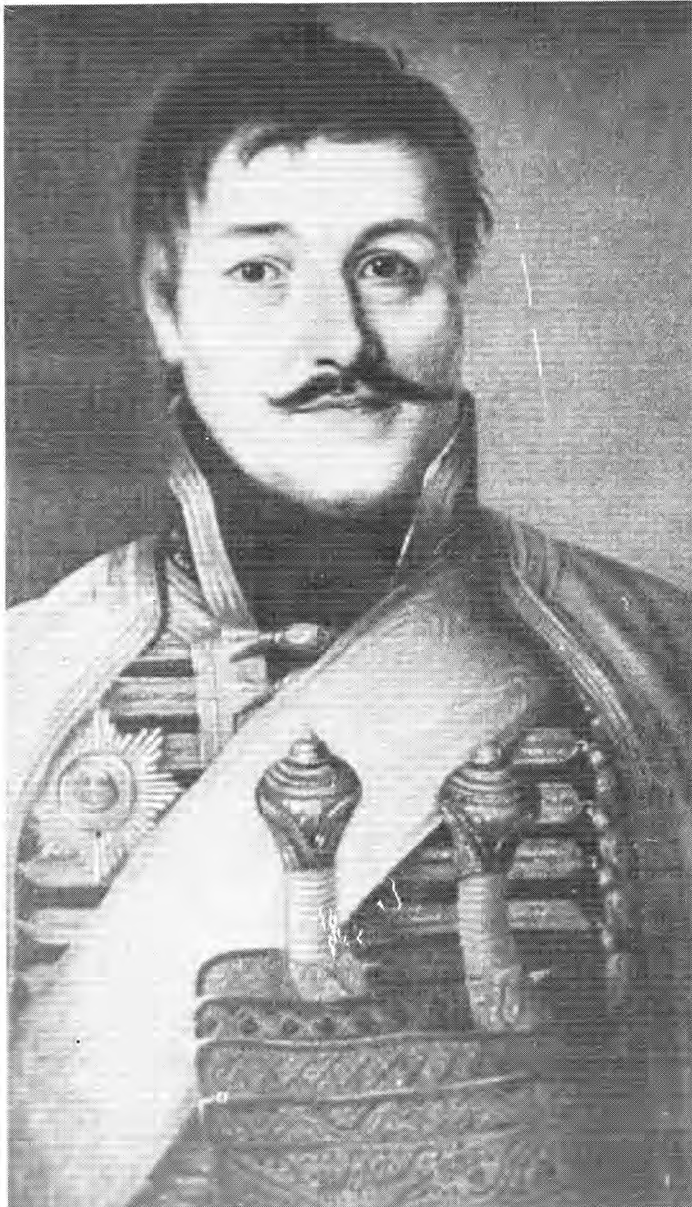
Карађорђе Петровић, вођа Првог српског устанка, старином из Васојевића