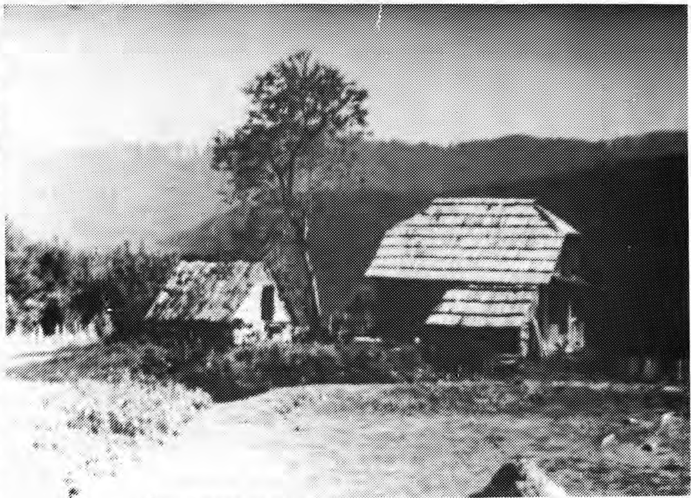
Некад типичан тип васојевићке куће: брвнара испод Трешњевића

Мутапа има у с. Прислоцима, Љубићки срез код Чачка. Они се сматрају као прави Васојевићи и држе се као рођаци са пресељеним Бојовићима тамо. У прилог је овоме и чињеница да су Васојевићи често насељавали око Сјенице и да је то, како је то познато, била једна главна етапа у миграционом струјању из тога краја и племена у Србију. Има још Мутапа на Тамнави (у селу Головићу) и у Азбуковачком срезу (у Горњим Кошљама), али није испитано јесу ли једно са овима код Чачка. За Хаи